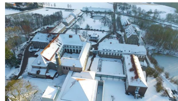
Hardehausen im Schnee